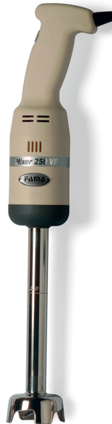
MIXER 250 VF